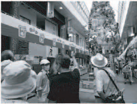
久しぶりに再開した博多まち歩きで、博多祇園山笠を見て回る参加者たち(7月)

コロナ禍でしばらく休止していました「博多まち歩き倶楽部」が、5月より再開となりましたことをご報告致します。